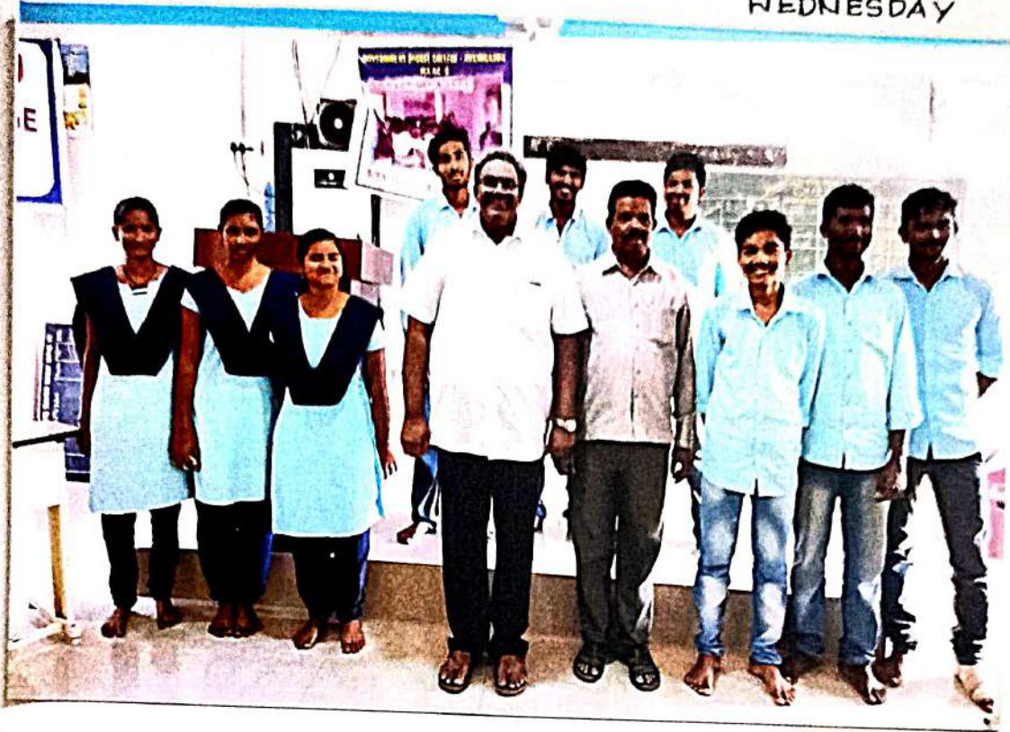
WINNERS OF "COMMERCE QUIZ" - 2020