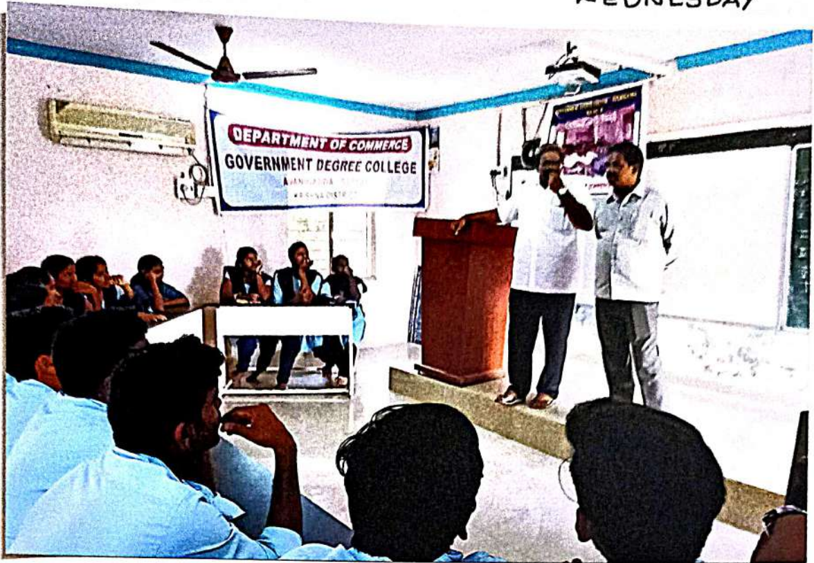
"COMMERCE QUIZ - 2020"